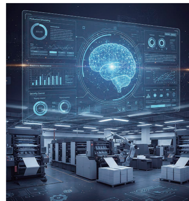
●圖9：人工智慧驅動的ERP在印刷產業中的最佳規劃

生成式AI不只是工具，更是印刷與包裝產業邁向智慧化、永續化再造引擎。從設計到交付，從客戶互動到供應鏈管理，AI正在重塑每個環節。對有志於國際化與永續發展的企業而言，擁抱AI不再是選項，而是必然。隨著印刷與包裝產業面臨數位轉型與