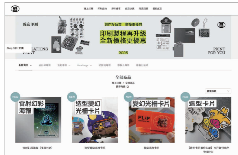
●圖8：台灣感官文化印刷導入漸強實驗室的AI行銷平台MAAC與對話平台CAAC，成功整合LINE、FB、IG 客服訊息

跨平台精準廣告投放，提升ROI。而面對Z世代對於廣告的注意力僅剩約1.3秒，注意力經濟已經轉變成銷售的挑戰。生成式AI創造各式的互動式內容，以延長注意力時間，提升品牌印象，也藉由互動訊息蒐集更精準的投放內容。(見圖9)