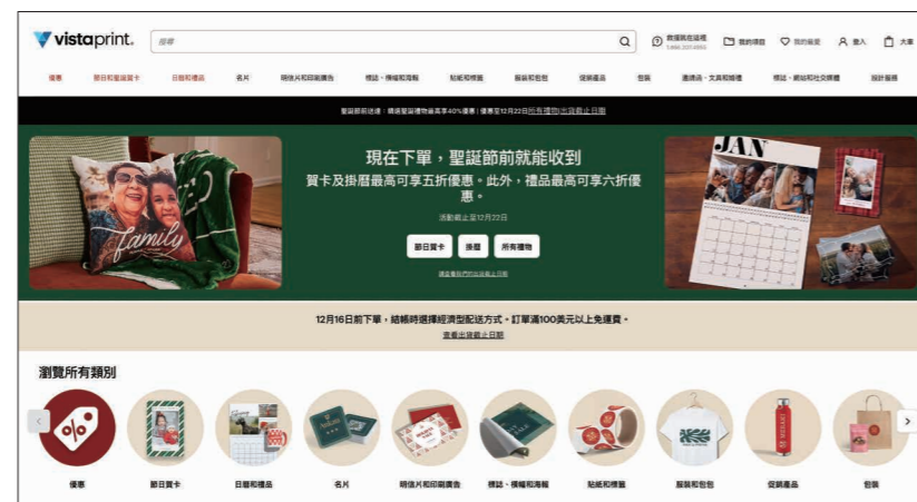
●圖5：VistaPrint是美國Cimpress旗下公司，幫助小企業主創建專業設計、最新的訂製銷售方案，即是他們需要的各種產品，讓其看起來和感覺專業、準備充分並適合應用

(一)設計與排版平台／客戶透過SaaS平台線上編輯名片、海報、包裝設計等。AI自動排版與