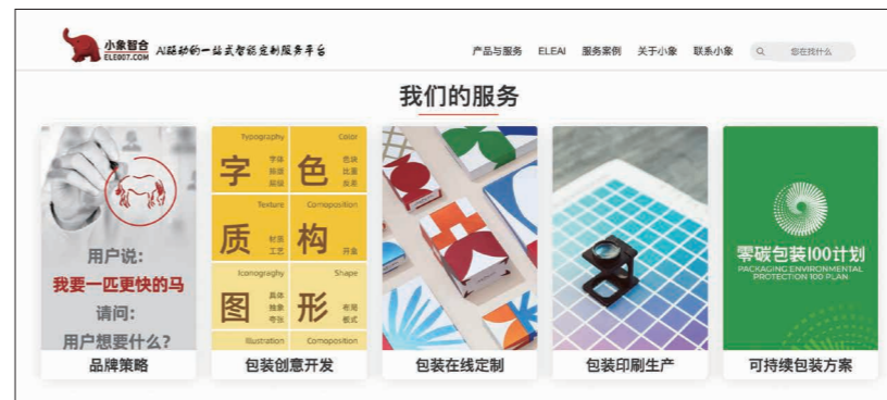
●圖2：中國小象智合是一家從設計到生產的包裝智慧服務平台，透過AI設計生成、智慧中台和超級雲工廠的生產落地能力，為品牌提供從專業包裝創新到印刷包裝供應的服務

(五)3D預覽與修改 ／使用者可360度檢視包裝設計，並即時調整圖形與文字，支援全自動與引導式設計模式。